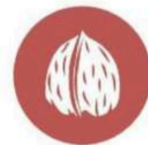
Frutos de cáscara