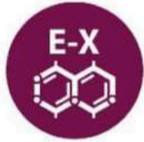
Dióxido de azufre y sulfitos